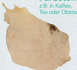
Farbstoff z.B. in Kaffee, Tee oder Obstsaft