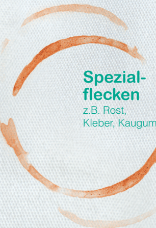
Spezial- flecken z.B. Rost, Kleber, Kaugummi