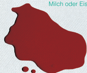
Eiweiß z.B. in Blut, Milch oder Eis